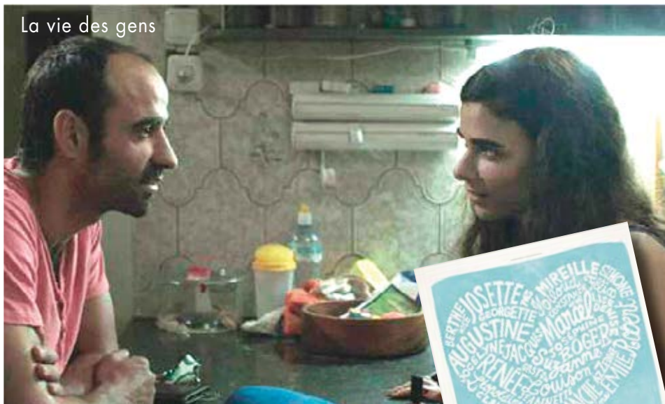
La vie des gens

Le cinéma israélien est un des plus surprenants au monde, 4 films, durant tout le mois de mai pour découvrir et mieux l'apprécier... En marge du très tendre Chelli, deux évènements à cette occasion, la venue du réalisateur Nadav Lapid pour son film L'Institutrice le mercredi 13 mai à 20h30 et une soirée le jeudi